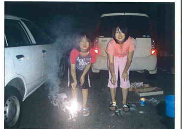
夜は子供と一緒に花火をしました、お盆休み最後の思い出です(*_**) あ〜、楽しい夏休みだったなあ♪

【あとがき】 先日、居酒屋にて隣に座るお客様が旬な食材の秋刀魚を食べていま した。それは、大きく油もたっぷり丸々と太っていました。先日のニュー スに北海道の漁協では今年も大きく豊漁という記事がありました。 また、被災した三陸沖から来る船も多岐にわたる記事もありました。 いつもより味わい深いかも知れないですね。復興を願いたくさん食 べたいと思います。